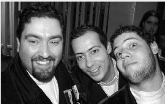
BIG © @Umdicas www.dicas.sas.uminho.pt