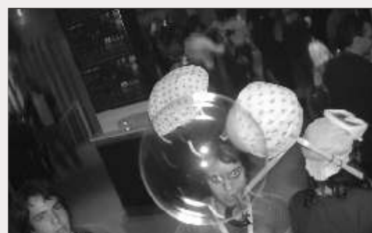
BIG © @Umdicas www.dicas.sas.uminho.pt