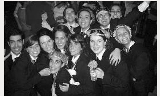
BIG © @Umdicas www.dicas.sas.uminho.pt