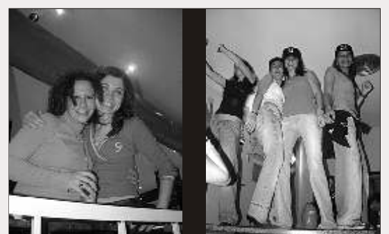
BIG © @Umdicas www.dicas.sas.uminho.pt